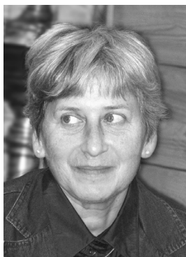
СЕДАКОВА ОЛЬГА АЛЕКСАНДРОВНА (Москва)

Поэт, прозаик, переводчик. Кандидат филол. наук, почетный доктор богословия Европейского гуманитарного университета (Минск), старший научный сотрудник Института мировой культуры МГУ. Лауреат литературной премии им. Андрея Белого (1982), Парижской премии русскому поэту, премии фонда Альфреда Топфера (обе — 1992 г.), Европейской премии поэзии (1996), литературной премии им. Вл. Соловьева, учрежденной Ватиканом (1998), Солженицынской премии (2003). Кавалер высшей награды Французской республики — ордена Почетного легиона. Член попечительского совета СФИ.