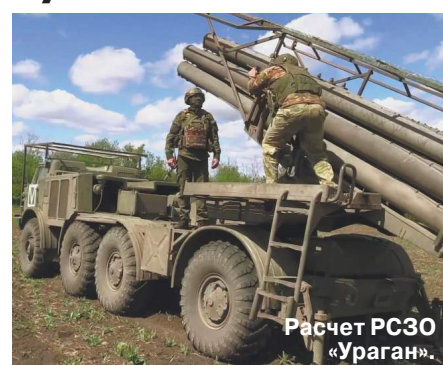
Расчет РСЗО «Ураган»

Важное событие произошло на Харьковском направлении во вторник, 14 мая: наши наступающие образовали практически единый фронт шириной до 60 километров. Идут бои за Липцы — населенный пункт в Харьковской области, потеря которого украинскими войсками обеспечит нашей артиллерии полный огневой контроль над Харьковом.